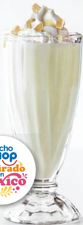
Pay de Limón