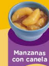
Manzanas con canela