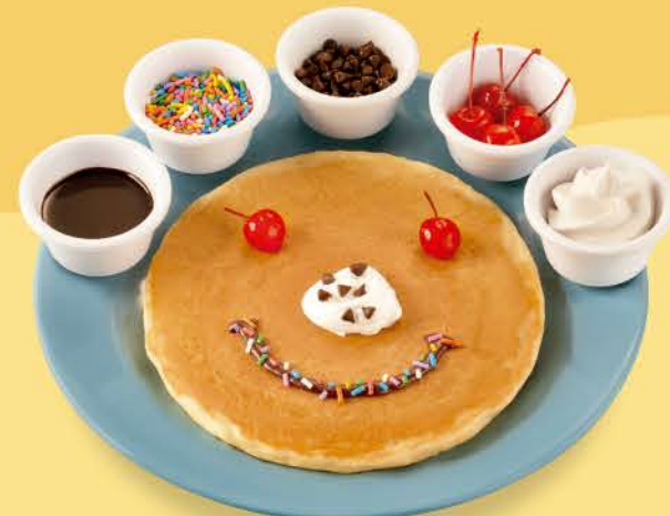
Decora tu Pancake

5 Silver Pancakes con mantequilla batida, 1 tira de tocino o 1 salchicha y 1 huevo revuelto.