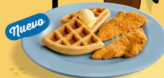
Chicken and Waffle Junior

Hamburguesa de res con queso americano y tocino. Acompañada de papas fritas.