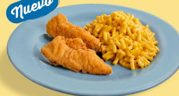
Mac & Cheese Junior

Mac & Cheese servido con selección de 2 crujientes tiras de pollo o 2 salchichas en forma de pulpo.