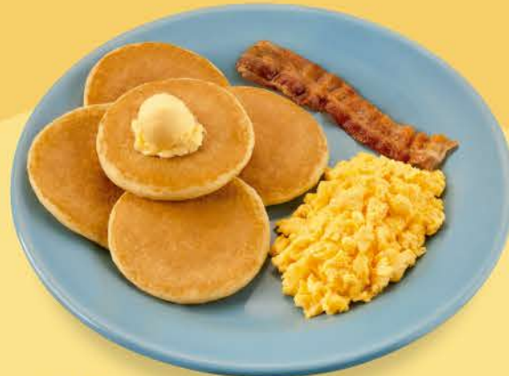
Silver 5 Pancakes

Belgian Waffle en forma de paleta, decorado con 4 divertidos toppings: Nutella® con plátano, Nutella® con M&M's®, salsa de vainilla con granillo de colores y salsa de vainilla con fresas rebanadas.