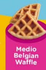
Medio Belgian Waffle