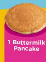
1 Buttermilk Pancake