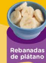
Rebanadas de plátano