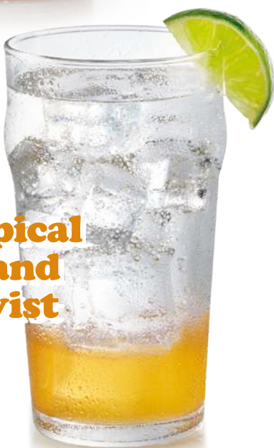
Tropical Island Twist