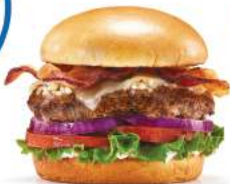
143. Garlic Burger

Hamburguesa de res (180 g), mantequilla de ajo, queso Cheddar blanco, tocino ahumado, lechuga, tomate y mayonesa.