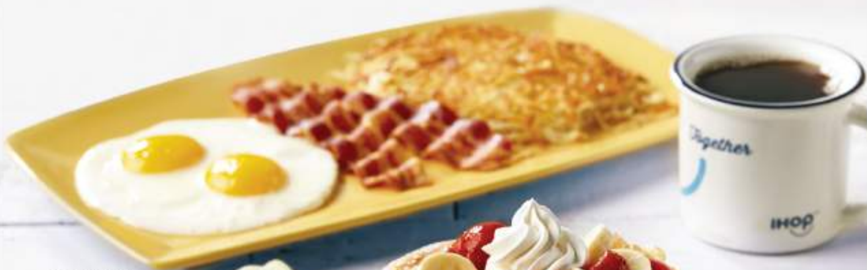
Strawberry Banana Combo

Compota de mora azul o de manzana con canela $35