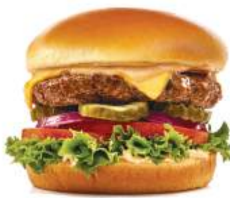
140. The Classic

Realmente una hamburguesa clásica de res (180 g) con queso americano, lechuga, tomate, cebolla morada, pepinillos y nuestra salsa de la casa IHOP®.