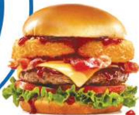
141. Cowboy BBQ

Hamburguesa de res (180 g), dos crujientes aros de cebolla, nuestro tocino ahumado, queso americano, lechuga, tomate, y nuestra salsa BBQ especial.