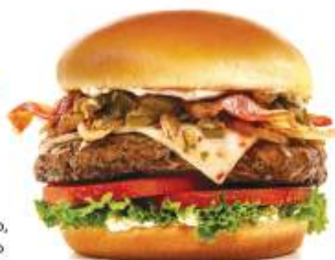
144. Jalapeño Kick

Hamburguesa de res (180 g), mezcla picante de chiles jalapeños y serranos con cebolla, tocino ahumado, queso Pepper Jack, lechuga, tomate y mayonesa.