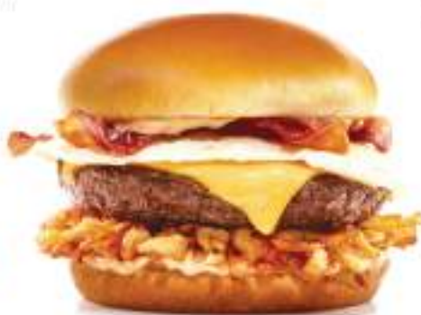
142. Big Brunch

Hamburguesa de res (180 g), tocino ahumado, huevo frito, papa crujiente, queso americano y nuestra salsa de la casa IHOP®.