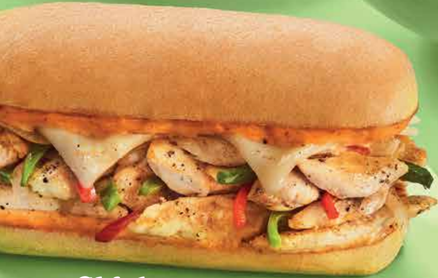
Chicken Fajita Philly