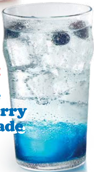
Blue Raspberry Lemonade