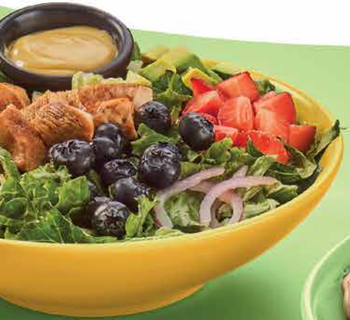
Fresh Berry Salad