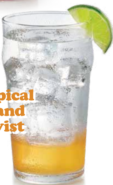
Tropical Island Twist