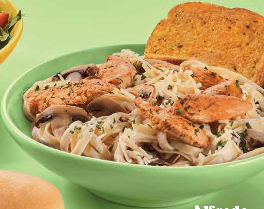
Alfredo Mushroom Pasta